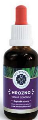
Vitis vinifera HROZNO

Hierba Luisa pochází z Indie a pěstuje se i v Jižní Americe. Nejčastěji je využívána jako pomoc při trávicích problémech (bolesti břicha, nadýmání, zácpa či překyselení žaludku). Pomáhá posílit mentální zdraví a celkovou psychiku člověka, je vhodná na depresi a nervové vyčerpání. Má široké antibakteriální, protiplísňové a protizánětlivé účinky, takže se hodí při nachlazení, chřipce, horečce anebo k likvidaci různých druhů virů a parazitů v lidském organismu.