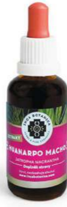
Jantrophia macrantha HUANARPO MACHO

Extrakt ze semínek hroznů má mnoho blahodárných účinků na celý organismus. Používá se při léčbě a prevenci cévních a oběhových problémů, jako je žilní nedostatečnost, periferní onemocnění cév a křečové žíly. Pravidelné užívání je rovněž doporučeno těm, kteří jsou ohroženi srdečním infarktem nebo mozkovou mrtvicí. Obsažené antioxidanty zabraňují oxidaci LDL cholesterolu a chrání tak cévní systém. Obsah resveratrolu podporuje dlouhověkost.