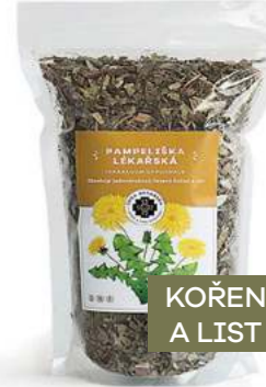
Obnova zažívání PAMPELIŠKA

Pro ženy v období menopauzy. Jedinečným způsobem vyrovnává a doplňuje energii při výkyvech nálad a depresivních stavech způsobených hormonální změnou. Vyvažuje činnost hormonálního systému těla tak, aby nedocházelo k přetěžování nervové soustavy. Celkově zklidňuje a navozuje dobrý spánek. Čistí organizmus od toxických látek a má silný protizánětlivý účinek. Pro zdravé kosti, klouby, vlasy a nehty. Složení: Cola de Caballo, Maca, Kotvičnick, Červený jetel, Vojtěška.