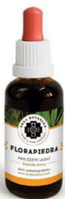
Pro čisté ledví FLORAPIEDRA

Obsahuje kombinaci bylin, které jsou známé pro svou schopnost snižování vysokého krevního tlaku. V extraktu je obsažena Fialová kukuřice, oplývající bohatou směsí vitamínů (A, B1, B2, B3, C), minerálů (železo, vápník, fosfor) a také je zdrojem nejsilnějších přírodních antioxidantů. Používá se při zvýšené hladině cholesterolu, oběhových potížích a nedostatečném prokrvení cévního řečiště. Uplatní se také při všech druzích zánětů a infekcí. Složení: Maiz morado, Hloh.