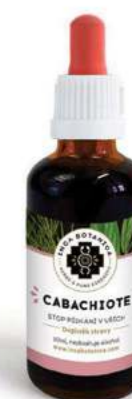
Stop pískání v uších CABACHIOTE

Extrakt Ambrosino, který kombinuje výtažky z Levandule, Kudzu a byliny Marco, je zaměřený na blahodárnu relaxaci nervové soustavy a posilu mozkové činnosti. Je možné Ambrosino použít při normalizaci problematických stavů autizmu. Obsažený kořen Kudzu se také prosadil v léčbě a odstraňování závislostí. Pomáhá ustát akutní záchvaty a rozkolísání emocionálního rozpoložení. Celkově je při pravidelném užívání dosaženo stabilizace mysli. Složení: Marco, Levandule, Kudzu.