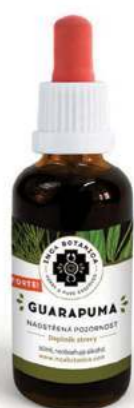
Naostřená pozornost GUARAPUMA

Je vhodný na posílení centrální nervové soustavy a zlepšení paměti. Zprůchodňuje prokrvení mozku, tím podporuje paměť, rozumové funkce i schopnost soustředění. Zvyšuje oxysolnění a prokrvení také dalších částí těla. Zajišťuje vydatnější přístup živin a odplavování škodlivých látek. Urychluje trávení a metabolismus. Ginkgo Biloba v kombinaci s Macou dodává sílu a životní elán. Maca má navíc skvělé výživové vlastnosti. Složení: Maca, Marco, Jinan.