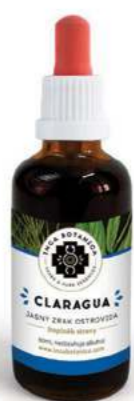
Jasný zrak ostrovida CLARAGUA

Na účinnou léčbu kardiovaskulárních obtíží. Harmonizuje nervový systém, při jehož zatížení vzniká častý problém srdeční arytmie či tachykardie. Snižuje tepovou frekvenci a krevní tlak. Využití nalezne při úzkostných stavech, stresu a rozčilení. Navozuje dobrou náladu a zvyšuje osobní vibraci. Cardica je rovněž nepostradatelná při léčbě nemocí dýchací soustavy, infekcích, zánětech horních cest dýchacích, zánět hltnu a bronchitidě. Složení: Srdečník obecný, Hojník horský.