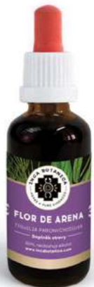
Tiquilia paronychioides FLOR DE ARENA

LEDVINY, UROLOGIE PŘEKYSELENÍ ORGANISMU NECHUTENSTVÍ, POCENÍ