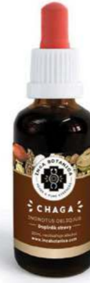
Inonotus obliquus CHAGA

Tento extrakt je považován v peruánské medicíně za jedno z neúčinnějších afrodisiak. Jedná se o oblíbený přírodní mužský sexuální stimulant, který je oprávněně nazýván „Peruánská viagra“. Kromě zlepšení sexuálních funkcí se používá i při cukrovce, dále při astmatických potížích a bronchitidě, jako stimulant pro podporu ledvin a nadledvinek, dále pro zklidnění a podporu centrálního nervového systému a také při žaludečních vředech.