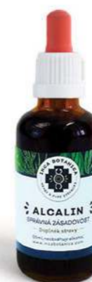
Správná zásadovost ALCALIN

Tento extrakt vznikl s cílem řešit problémy s prostatou a hormonální rovnováhou mužů. Hlavní složka receptury Achioté se tradičně používá při problémech s prostatou, při vnitřních zánětech, nedostatečné funkci ledvin, zánětech močového měchýře, ledvin a ke zlepšení vylučování kyseliny močové. Harmonizuje a posiluje srdeční funkce, je doporučován při arteriální hypertenzi, vysokém cholesterolu a obezitě. Složení: Achioté, Kotvičník, Vrbka úzkolistá.