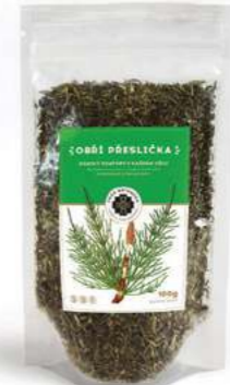
Pro dámský komfort OBŘÍ PŘESLIČKA

Směs pro ženy s nepravidelnou a bolestivou menstruací. Pomáhá jak při akutních stavech, tak jako prevence. Při silných bolestech doporučujeme přidat Majoránku (1/2 čajové lžičky na hrníček čaje). Tato směs napomáhá rovněž eliminovat kvasinkové onemocnění, působí jako stimulant, afrodiziakum a antiseptikum, uvolňuje hladké svaly a zabraňuje křečím. Navozuje pocit pohody a odpočinku. Složení: Matico, Meduňka, Řebříček, Kokoška pastuší tobolka.