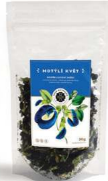
Modře lucidní snění MOTÝLÍ KVĚT

Směs pro pravidelnou detoxikaci těla. Dokonale čistí krev, odvádí toxiny a pomáhá z těla vylučovat přebytečnou vodu. Zlepšuje trávení, posiluje játra, žlučník a snižuje vysokou hladinu cholesterolu. Uplatňuje se při jaterních onemocněních, jako jsou záněty a například cirhóza. Je vhodný také při infekčních onemocněních a horečce. Směs podporuje zdravé hubnutí a dobré trávení. Během očistné kúry doporučujeme vynechat alkohol. Složení: Hecampuri, Malina, Hluchavka, Pýr, Lopuch.