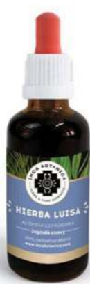
Aloysia citrodora HIERBA LUISA

Tato rostlina je známá již od dob Inků, kteří ji používali ke snížení horečky a na bolesti žaludku. Spouští silnou detoxikaci a zlepšuje tak činnost jater a žlučníku, snižuje hladinu cholesterolu a usnadňuje trávení. Na jaterní onemocnění, diabetes a s ní spojenou nadváhu. Významně očisťuje krevní řečiště a celý organismus. Bývá používán při šamanském výcviku pro podporu vytělesnění. Není vhodné užívat v případě žaludečních vředů.