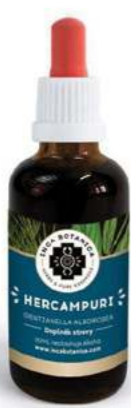
Gentianella alborosea HERCAMPURI

Extrakt je hojně využíván k čištění ledvin a eliminaci zánětů močových cest a sliznic. Purifikuje také neuroendokrinní systém. Flor de Arenu doporučujeme lidem s nadměrným pocením, jelikož látky obsažené v extraktu odstraňují adrenalin a kyselinu mléčnou. Bylina pomáhá také při zažívacích obtížích, jako je nechutenství nebo překyselení žaludku. Nedoporučujeme podávat dětem, těhotným a kojícím ženám.