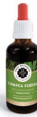
Phyllanthus niruri CHANCA PIEDRA

Léčivá houba Chaga patří mezi nejsilnější antioxidanty na světě. Je hlavním bojovníkem proti stárnutí a skvěle reguluje imunitu. Její antioxidační, antivirové a antibakteriální schopnosti jsou tak silné, že jsou schopné zastavit růst onkologických nádorů, HIV viru nebo pohlcovat radioaktivní záření. V těle spouští silný detoxikační proces a vyživuje jej novými vitamíny a minerály. Také pomáhá se stresem, uklidňuje psychiku a dodává životní elán.