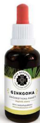
Občerstvená paměť GINKGOMA

Extrakt je speciálně připraven pro podporu správné funkce ledvin, jejich pročištění a také detoxikaci krve, tělesných sliznic a celého organismu. Florapiedra zároveň účinně čistí močové ústrojí. Dokáže zbavit tělo zánětů a parazitů, pročistit močový měchýř a ledviny. Součástí extraktu je bylina Flor de Arena, která působí antibakteriálně a antimykoticky. Složení: Flor de Arena, Chancapiedra, Benedikt, Hercampuri, Zlatobýl.