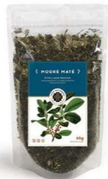
Tělo štíhlé jako proutek MODRÉ MATÉ

Kůra ze stromu Lapacho je jeden z nejučinějších adaptogenů. Detoxikuje tělo od kovů, usazenin, ničí plísně i bakterie, léčí kvasinkové záněty. Zlepšuje krevní oběh, optimalizuje vysoký krevní tlak a mírní symptomy diabetu. Posiluje srdce, játra, ledviny a látkovou výměnu. Působí protizánětlivě, zlepšuje imunitu a jsou známy její účinky při prevenci a boji s leukémií a rakovinami. Obsahuje flavonoidy, vitamína a minerální látky. Složení: Tabebuia avellanedae (Impetiginosa-cortex).