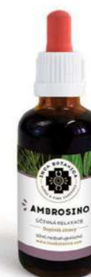
Účinná relaxace AMBROSINO

Alcalin je ideální prostředek k důkladnému odkyselení a celkové detoxikaci organismu. Podporuje správné zažívání, řeší problémy v oblasti trávicího traktu, nechutenství a nadýmání. Ulevuje od bolestivé menstruace a tlumí negativní příznaky menopauzy. Rovněž má blahodárny vliv na močové ústrojí, bojuje proti zánětům a zlepšuje funkci ledvin. Zvyšuje látkovou výměnu, čímž přispívá k rychlejšímu vyprazdňování odpadových látek z těla. Složení: Vojtěška, Petržel.