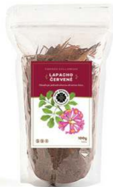
Uzdravující strom LAPACHO

IMUNITA DETOXIKACE PROTIRAKOVINNÉ ÚČINKY