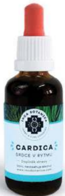
Srdce v rytmu CARDICA

SRDEČNÍ ARYTMIE OBĚHOVÝ SYSTÉM PLÍCE, DÝCHACÍ CESTY