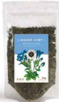
Konec otravným jedům MODRÝ KVĚT

Směs pro odbourávání tukových buněk při redukčních dietách. Má posilující účinky na nervový a imunitní systém, odstraňuje únavu, pocit hladu a je tedy vhodným doplňkem při snižování váhy, podporuje správné trávení a má diuretické účinky a zároveň detoxikační účinky. Pro posílení imunity, vitalitu a zpomalení stárnutí. Dodává tělu velké množství aminokyselin, minerálů, pryskyřic a vlákniny. Neobsahuje kofein. Složení: Cesmína paraguayská, Hecampuri, Hierba Luisa.