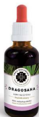
Viry na útěku DRAGOSANA

Extrakt Claragua je určený na podporu dobrého zraku. Canchalagua, hlavní přísada směsi, byla indiány známá především jako pomocník pro důkladnou očistu jater a žlučníku. Borůvka a Světlík lékařský podporují celkovou detoxikaci a výrazně posilují zrak. Claragua zlepšuje kvalitu kůže, vyživuje vlasy a nehty, reguluje nepravidelnou menstruaci. Zevně nalezne využití v hojení ran, eliminaci plísní a kvasinek. Složení: Canchalagua, Borůvka, Světlík lékařský.