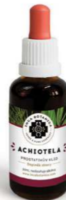
Prostatikův klid ACHIOTELA

Vícedruhové extrakty byly vyprojektovány jako maximálně účinný a silný prostředek při odstraňování zdravotních obtíží. Vzhledem k intenzitě je nutno na začátku jejich užívání postupovat opatrněji, než u obvyklých bylinných přípravků. Receptury jsou kombinací amazonských a exotických bylin a tradičních českých léčivěk. Extrakty jsou vyrobeny několikanásobnou extrakcí a neobsahují alkohol.