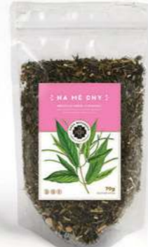
Každý měsíc v pohodě NA MÉ DNY

Nálev z magické rostliny Clitoria ternatea, aneb Motýlí květ, má nádherně modrou barvu a schopnost oživit sny a podpořit lucidní snění. Je hotovým zázrakem pro naši nervovou soustavu a tím i proti depresím. Květ obsahuje flavonoidy podílející se na řadě ozdravných procesů v těle. Má tonizační a protizánětlivý efekt, zlepšuje krevní oběh, vyživuje pleť i vlasy, upravuje menstruační cyklus, podporuje plodnost a také trávení. Složení: 100% Clitoria ternatea.