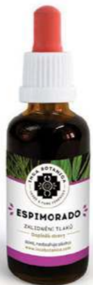
Zklidnění tlaků ESPIMORADO

VYSOKÝ KREVŇÍ TLAK CHOLESTEROL ZÁNĚTY A INFEKCE