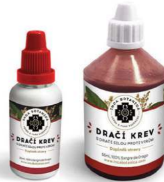
S dračí silou proti záškodníkům DRAČÍ KREV - SANGRE DE DRAGO

VIRY A ZÁNĚTY PŘÍRODNÍ ANTIBIOTIKUM HARMONIZACE TRÁVICÍHO TRAKTU